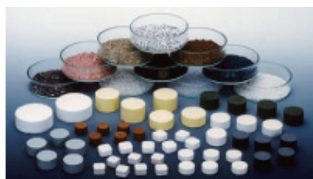
■蒸着材料 (キヤノンオプトロン製)

同社では、イオンビームやレーザーを用いた各種プロセス装置、GCIB(ガスクラスターイオンビーム)応用のナノ加工システム装置など、最先端の製品を扱っています。中でも真空蒸着用の材料は、RoHS指令やREACH規制の対応が不可欠で、化学物質管理が求められていました。そのため、化学物質管理に関するルール的基本的な考え方や、それらに基づくグリーン購入等についての学習講座を専門講師を招いて実施し、社員の意識向上につなげていきました。また、省エネ、省廃棄物の管理システムの構築や、日常の事業活動の見える化など、基本的な体制づくりを行っていきました。